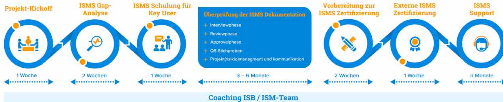
Vorgehensweise / Ablauf ISMS-Einführung